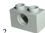
2 балка 1x2