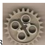
13 зубчатое колесо 24