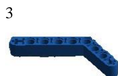
3 изогнутая балка 1 x 9