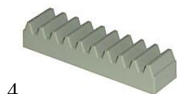
4 зубчатая рейка