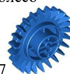
17 коронное колесо