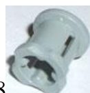
8 универсальная втулка