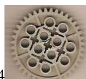
14 зубчатое колесо 48